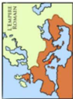
La carte de l'empire