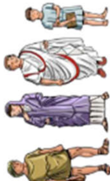
Une famille romaine